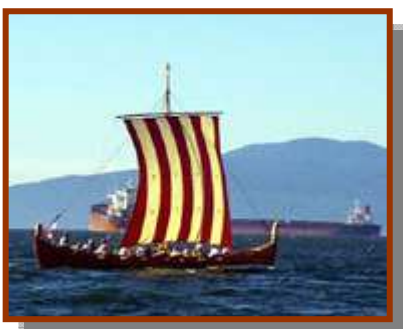
Het hedendaags tijdverdrijf