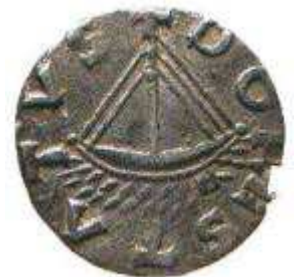
Deze munt met de teskt Dorestad is gevonden in Wijk bij Duurstede

Als 1 e bouwden ze overnaadse spitsgatters schepen die voor en achter in een punt uitliepen met overlappende huidgangen, dit evolueerde binnen 8 eeuwen tot het bekende Vikingschip wat erg populair werd, behalve voor diegene die bezoek van zo'n stelletje schepen kreeg in Wijk bij Duurstede het vroegere Dorestad weten ze er alles van te vertellen. De overnaadse dakpansgewijs over elkaar liggende planken maakten dit type schip tot een licht, vreekkrachtig zeer zeewaardig en snel te zeilen schip met een geringe diepgang, lokaal zie je in de Scandinavische landen nog wel eens mensen in een afgeleide van een Vikingschip varen als tijdverdrijf op vrijedagen.