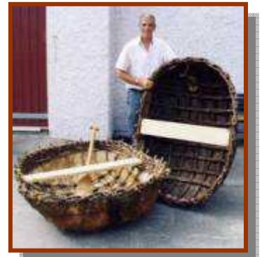
Replica's van een "Welsh coracle"

Van oorsprong lederen boten waren de en de Welsh coracle, tegenwoordig zijn deze schepen met geteerd canvas bekleed. Deze op boodschappen mandjes lijkende vaartuigen worden gewrikt met 1 peddel. Ze werden en worden vaak aan de kust gebruikt er werd al in de 10 e eeuw overgeschreven in een manuscript NAVIGATIO BRENDANI ook wordt hierin verslag gedaan van de reis in de 6 e eeuw van de Ierse abt Brandaan die volgens de legende in zo' n schuitje tot de Azoren gekomen zou zijn. Mogelijk hebben meerdere monniken deze reizen ondernomen maar al die kaalgeschoren kerels in hun bruine pij leken veel op elkaar, zodat ze mogelijk voor dezelfde aangezien werden. Het was toch een huzaren stukje zonder enig navigatie middel een dergelijke reis, dat wij naar deze Brandaan een vuurtoren hebben genoemd (de Brandaris) op Terschelling.