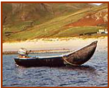
Hobbyisten maken nog steeds "Ierse curraghs".

Om al de verhalen te testen stak een Ierse onderzoeker in 1977 in een curragh van 12 meter en voorzien van 42 koeiehuiden de oceaan er mee over hij deed er ½ jaar over, maar het lukte hem toch maar. Spitsuur werd het rond de 10 e eeuw, door overbevolking gedwongen verlegden de Denen hun blik over de zee, zij vestigde nederzettingen in Normandië en Engeland. Terwijl de Noren het zelfde deden op IJsland Groenland en Newfoundland. Deze Scandinavische volken bouwden eerst schepen van leder, maar met de komst van het ijzer leerden ze gereedschap maken voor de bewerking van hout. Bijlen dissels en beitels voorzagen ze van een geharde laag staal en maakten deze zo bruikbaar voor de houtbewerking.