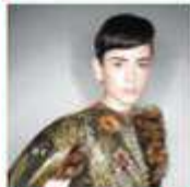
ZEEUWS MUSEUM Middelburg