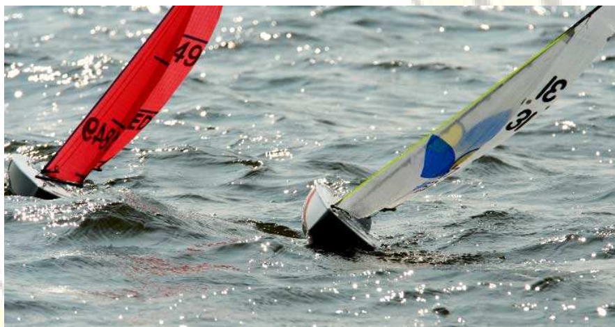
MM's in Actie in Frankrijk 2010

De "Eerste Nationale Micro Magic Frankrijk" .