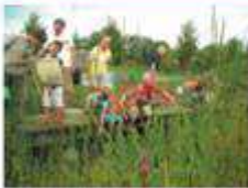
TERRA MARIS Oostkapelle