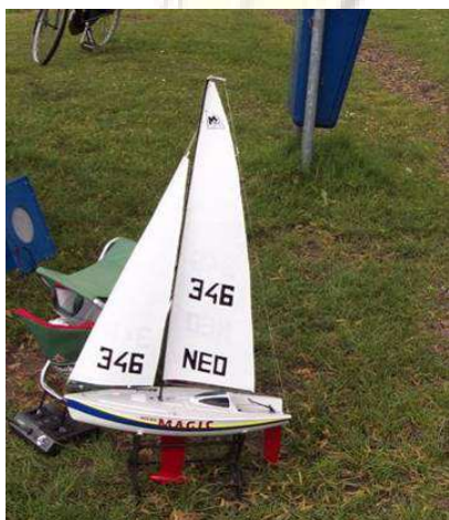
Een standaard MM boot

Enfin, als ik de fervente MM liefhebbers met deze passerende hekgolf in hun kuipje een nat kruis bezorg, haal ik wel even bakzeil en zal het weer goedmaken. En wel met een impressie van hetgeen ik als "buitenstaander" in dat magazine "Bateau Modèle" over het Franse MM gebeuren las, en op de foto's zag: vier pagina's maar liefst, het bleek uiteindelijk een kneuterig verhaal, met dien verstande dat er geen riekende spruitjes bij op tafel kwamen maar oesters.