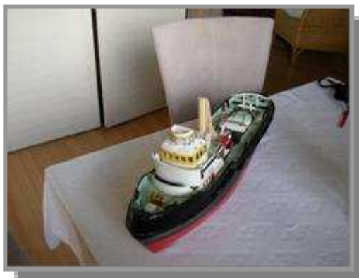
Zo zag zij er uit op de clubavond

Vervolgens de stoute schoenen aangetrokken en mijn gehele bouwsel in een doos verpakt en hiermee naar een clubavond getogen.