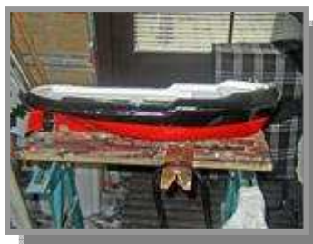
Langzaam maar zeker begint het ergens op te lijken