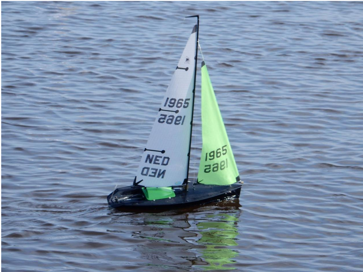
Op deze foto zie je het nog beter je kan met deze afstelling van de fok niet hoog zeilen