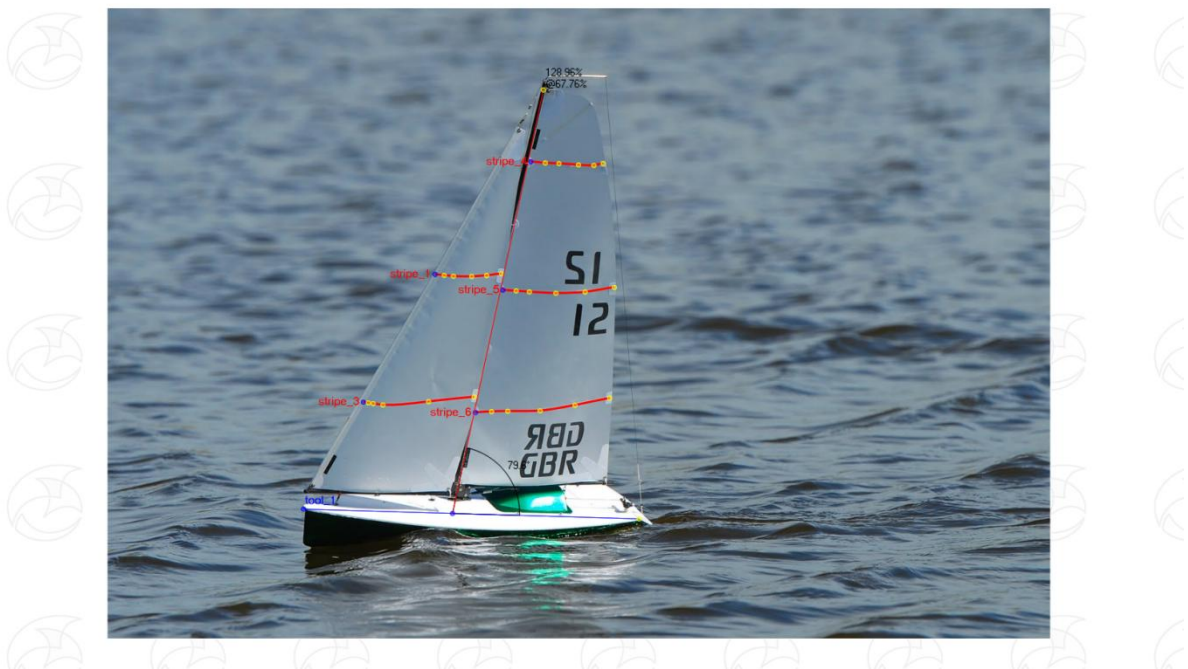
Hier zie je hoe het er bij moet staan aan de wind ik heb wat rode lijnen op het zeil gezet